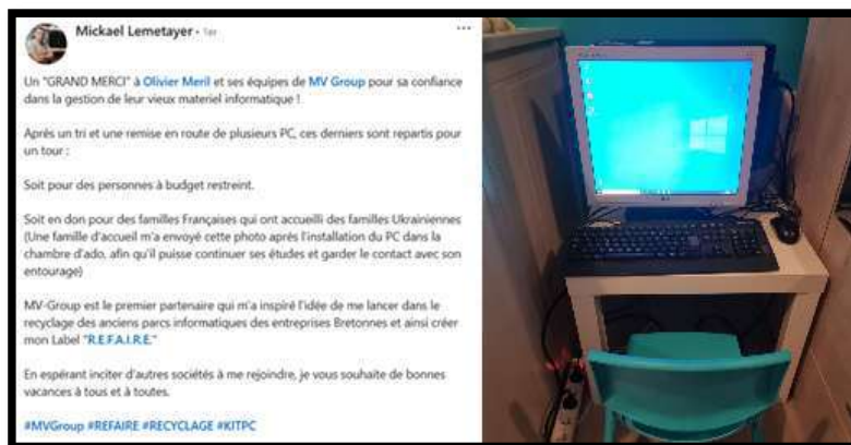
Capture d'écran d'un poste LinkedIn en collaboration avec Mickael Lemetayer de KIT PC

Enfin, afin de valoriser l'opération, une publication illustrée retraçant l'action solidaire et la remise du matériel est partagée sur LinkedIn. Ce type de communication met en avant l'engagement responsable du groupe, remercie les partenaires et permet de sensibiliser l'ensemble des collaborateurs à la démarche RSE portée par l'entreprise.